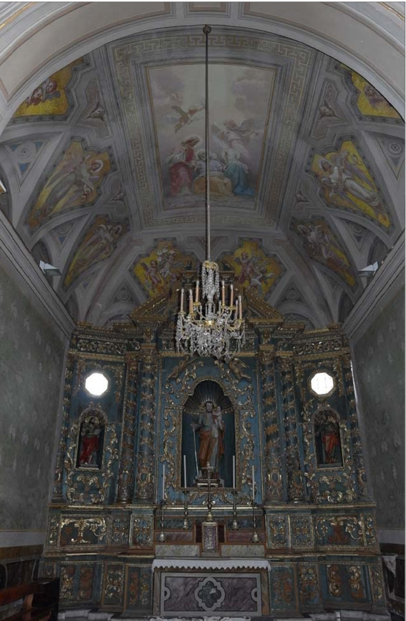
22 - Cappella 3 (di San Giuseppe)