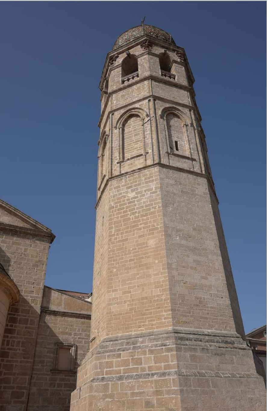
19 - Campanile