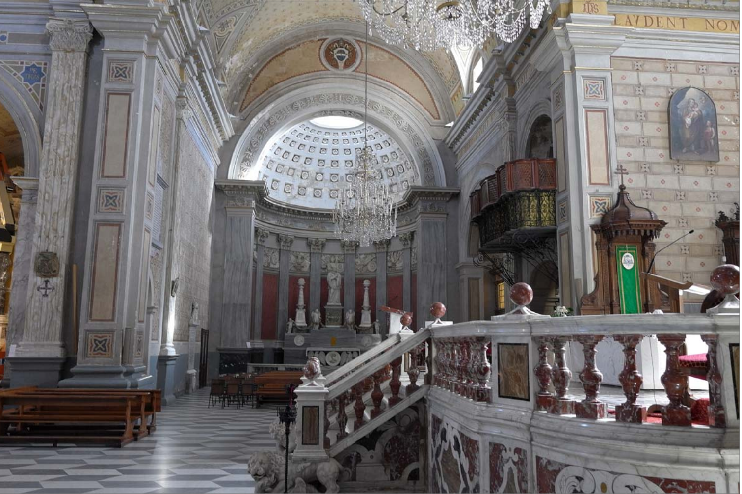
10 - Transetto sinistro