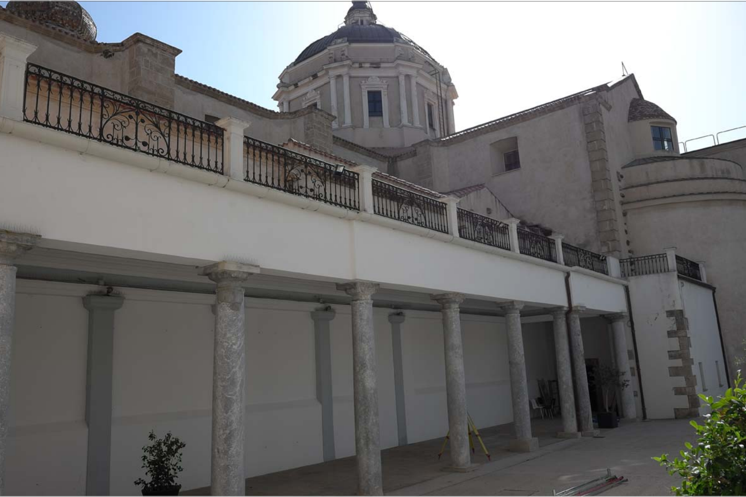
4 - Prospetto destro interno al cortile del museo diocesano