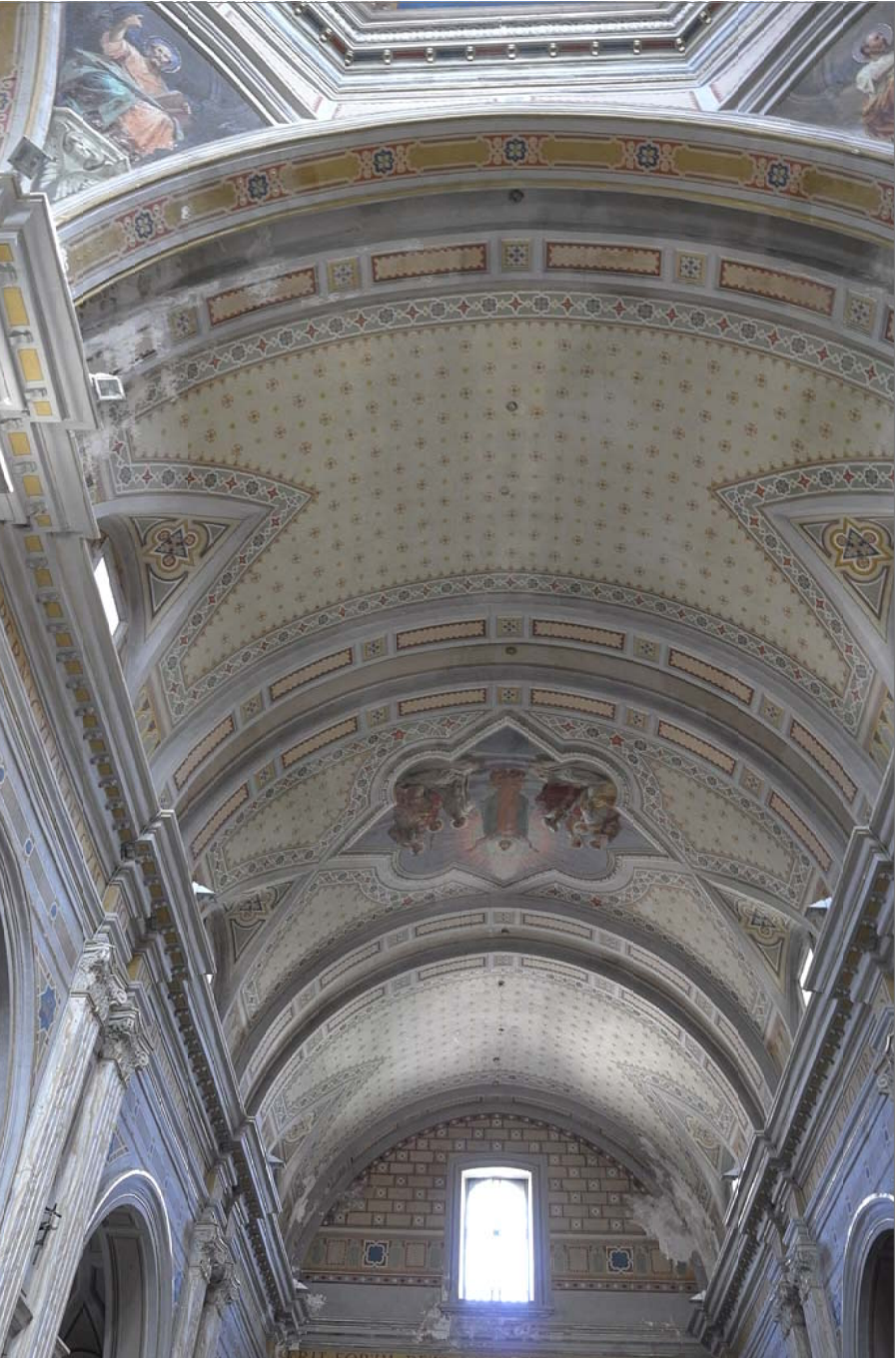
14 - Volta della navata