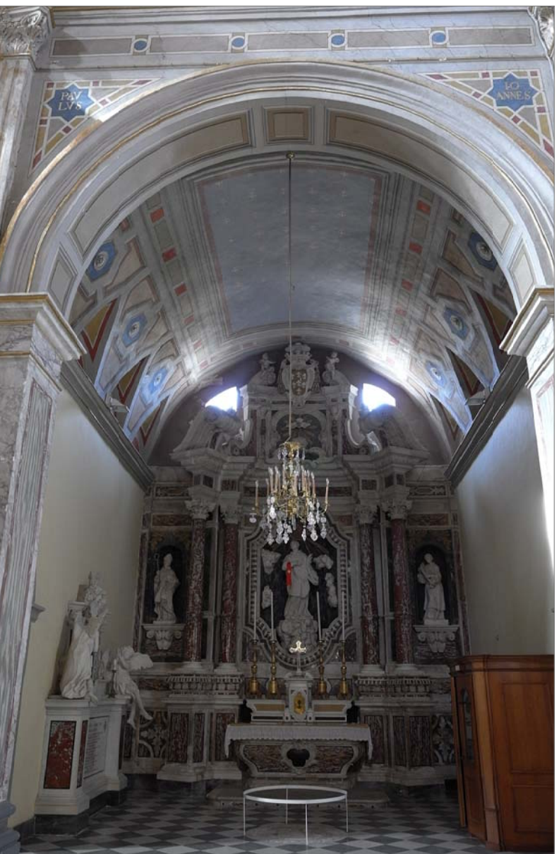
24 - Cappella 2 (di Sant'Archelao)