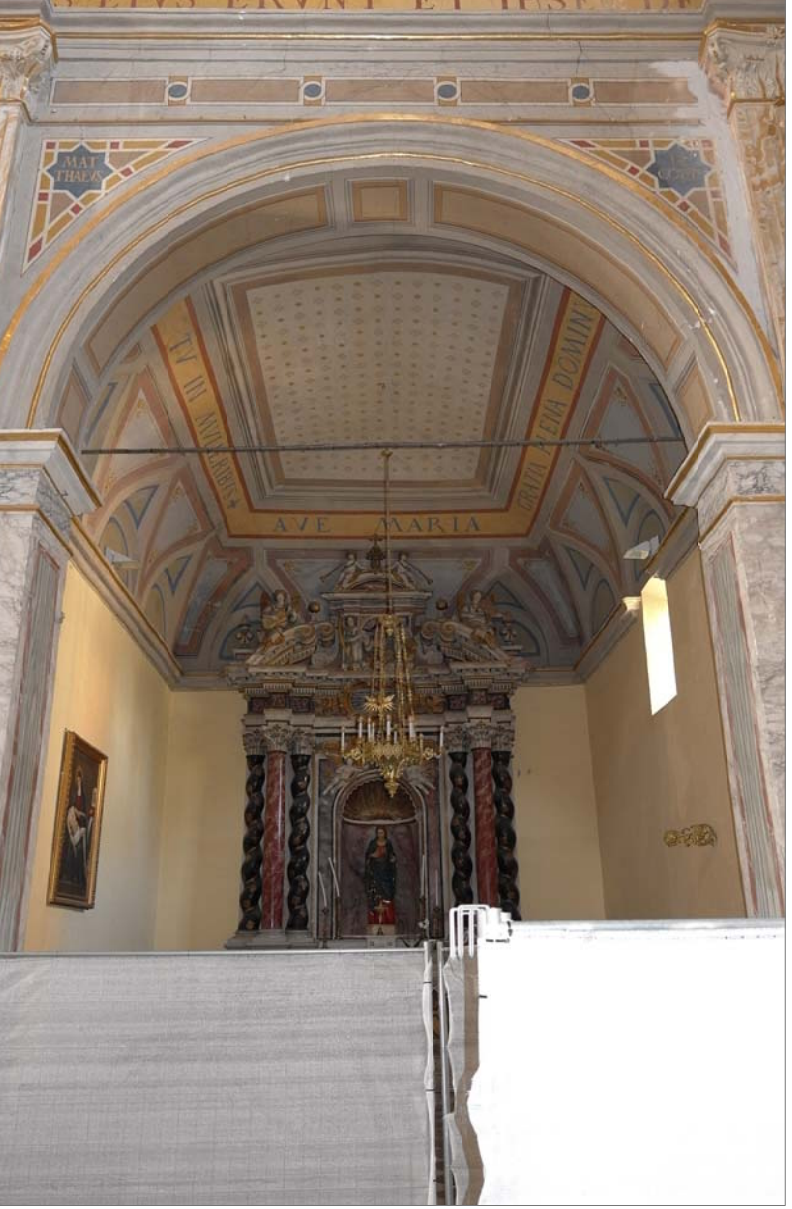
26 - Cappella 6 (dell'Annunziata)