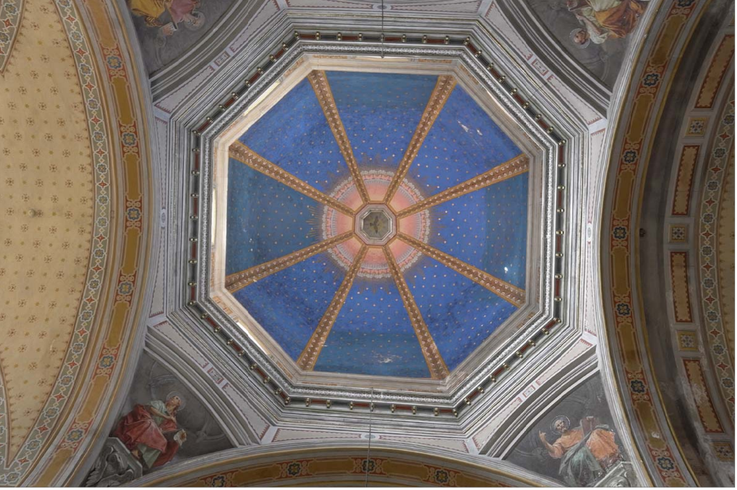
11 - Interno della cupola