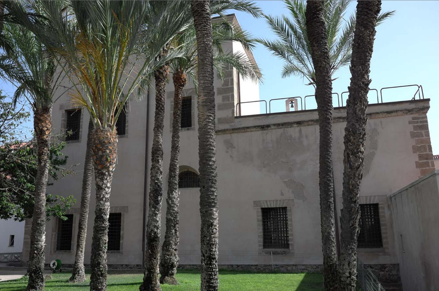
3 - Prospetto destro interno al cortile del museo diocesano