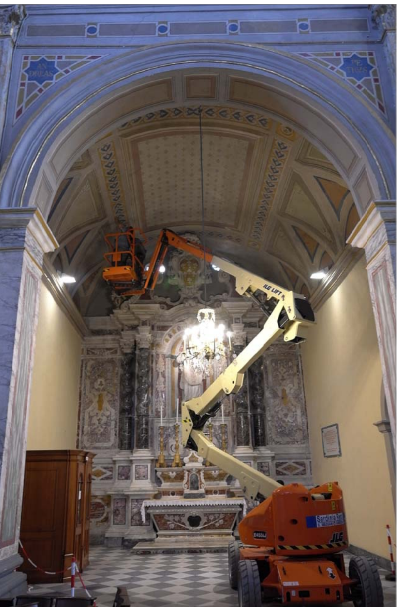
21 - Cappella 1 (di San Filippo Neri)