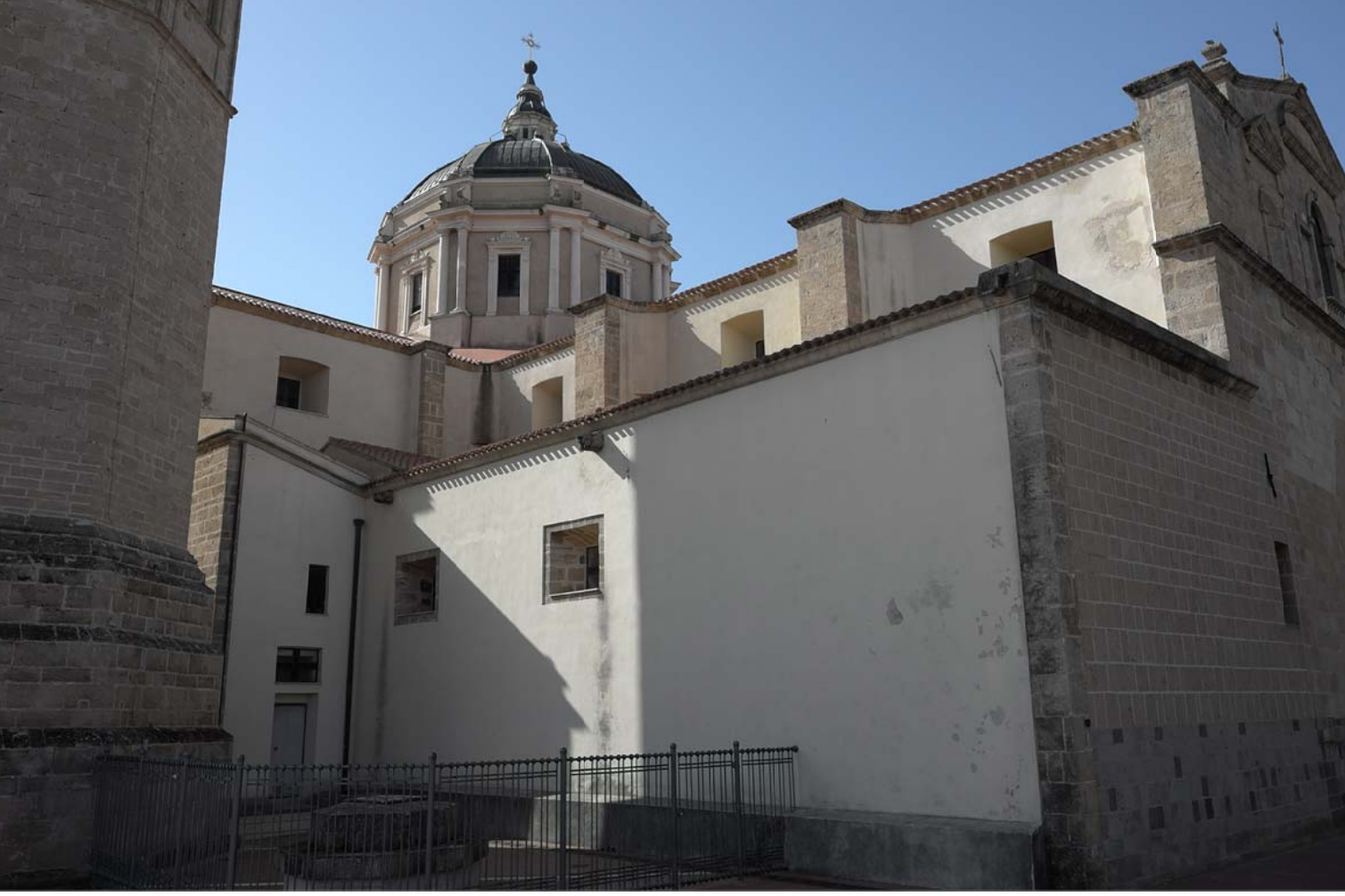
2 - Lato sinistro