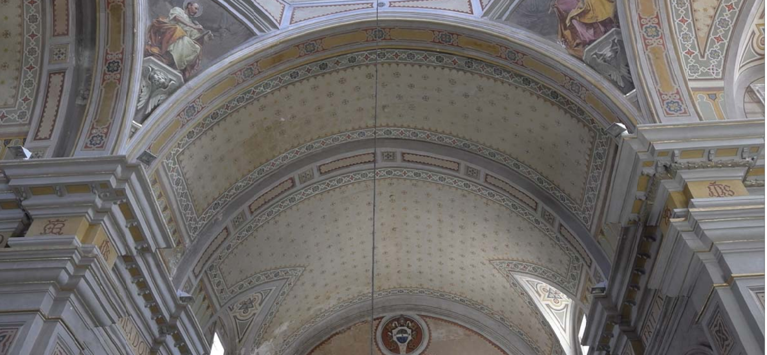
12 - Volta della navata