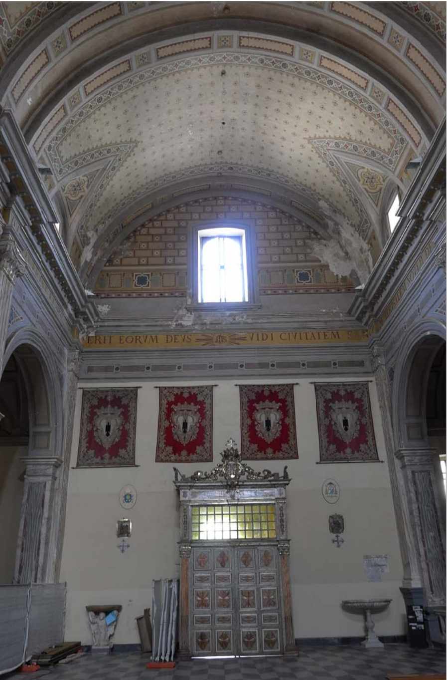
18 - Particolare della bussola