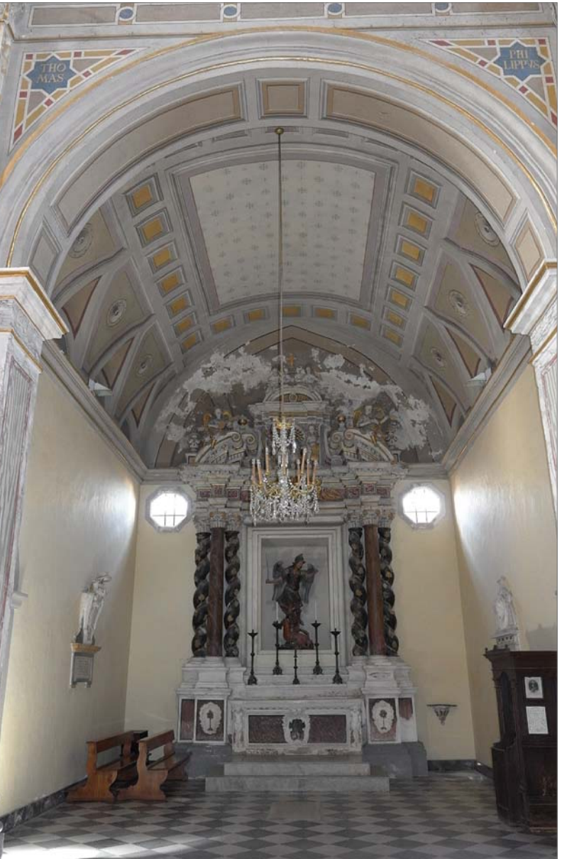
25 - Cappella 4 (di San Michele)