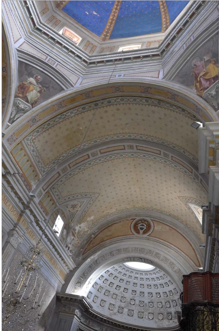
13 - Volta del transetto sinistro