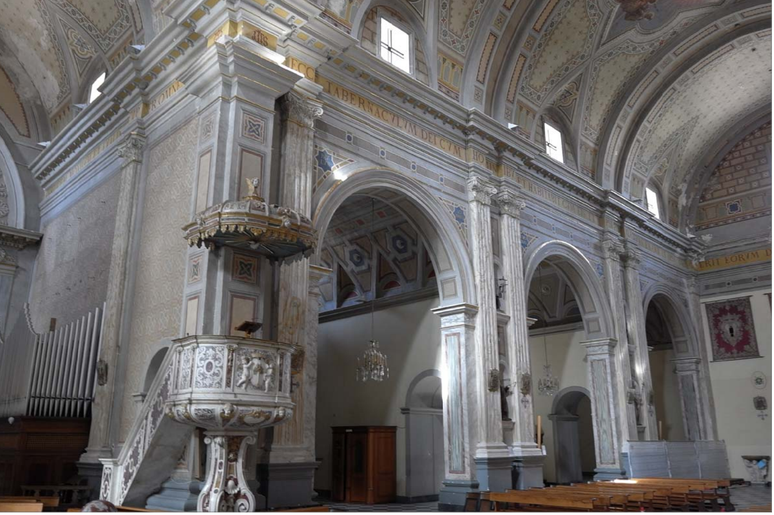
8 - Navata centrale e pulpito