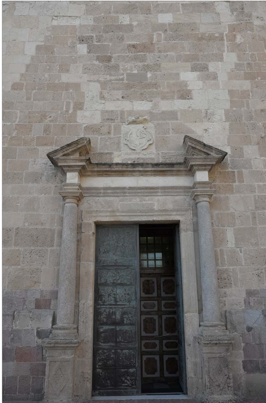
17 - Particolare del portone di ingresso Pianta coperture_Scala 1:100