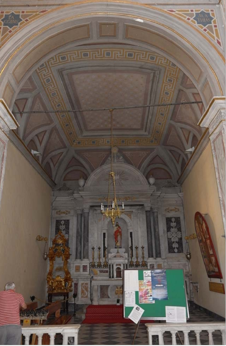
23 - Cappella 5 (del Sacro Cuore)