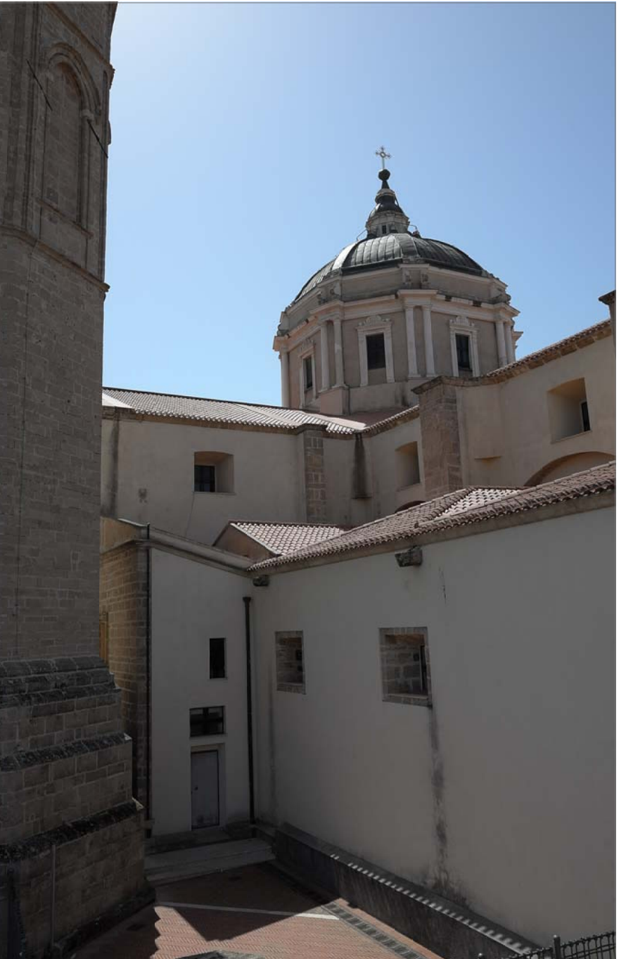
20 - Prospetto sinistro dietro al campanile