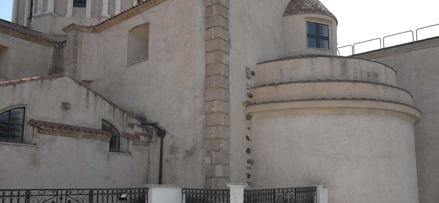
6 - Prospetto lato destro