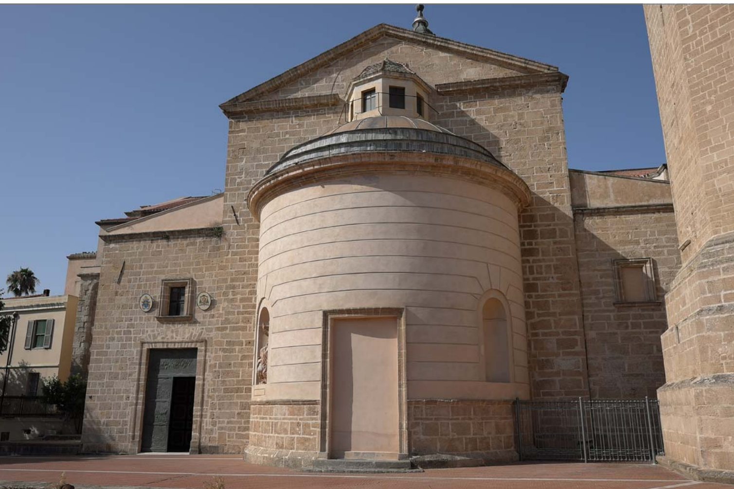
1 - Ingresso