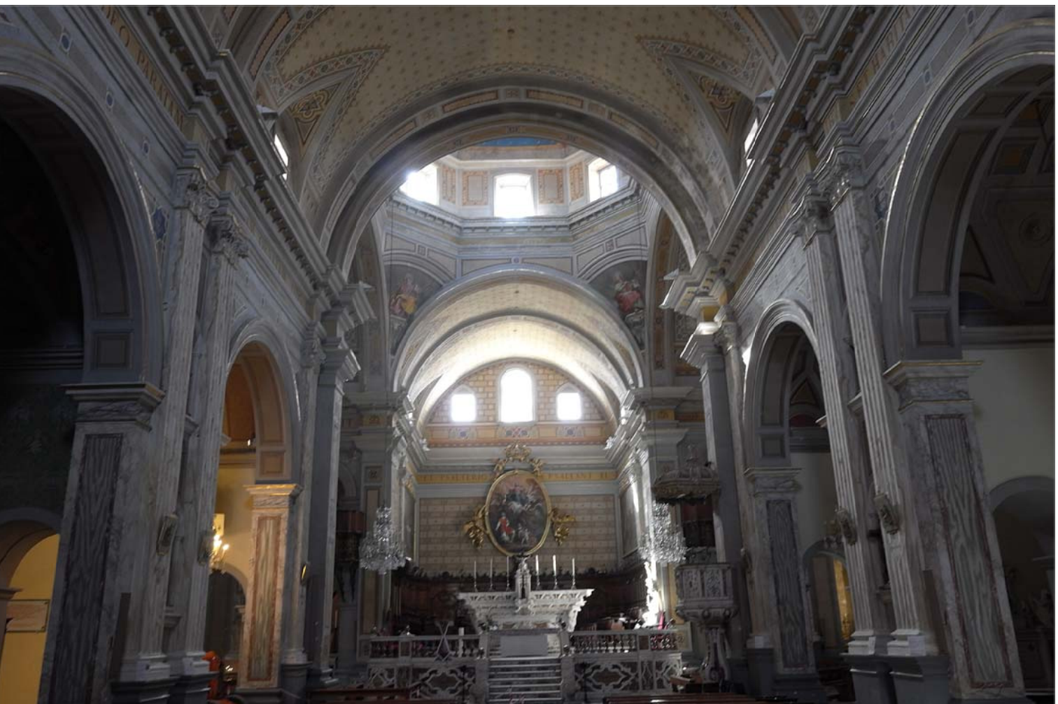
7 - Presbiterio e coro