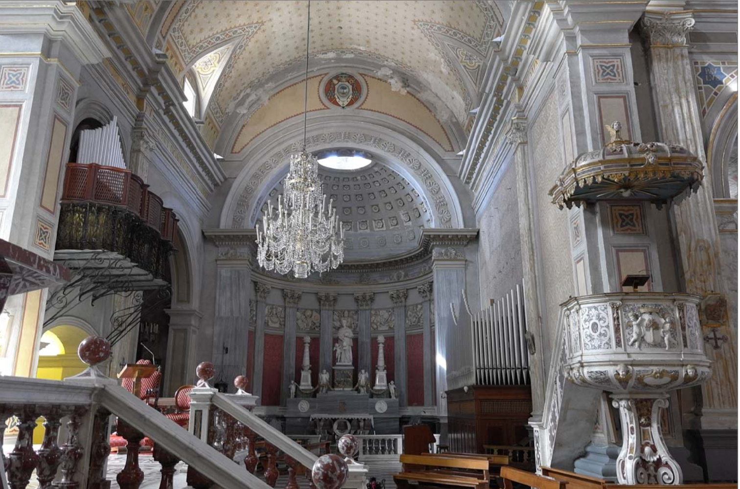
9 - Transetto destro