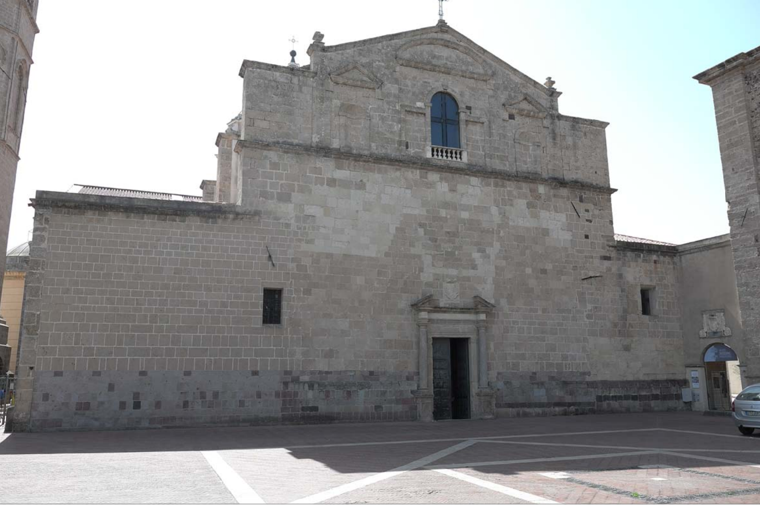
5 - Prospetto principale