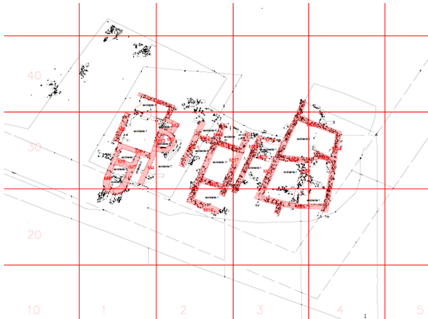
Fig. 2) Inquadramento dell'area oggetto di rilievo Piccole Terme di Neapolis