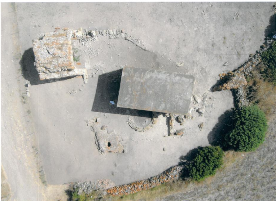
Fig. 3) Foto aerea dell'area oggetto di rilievo Grandi Terme di Neapolis